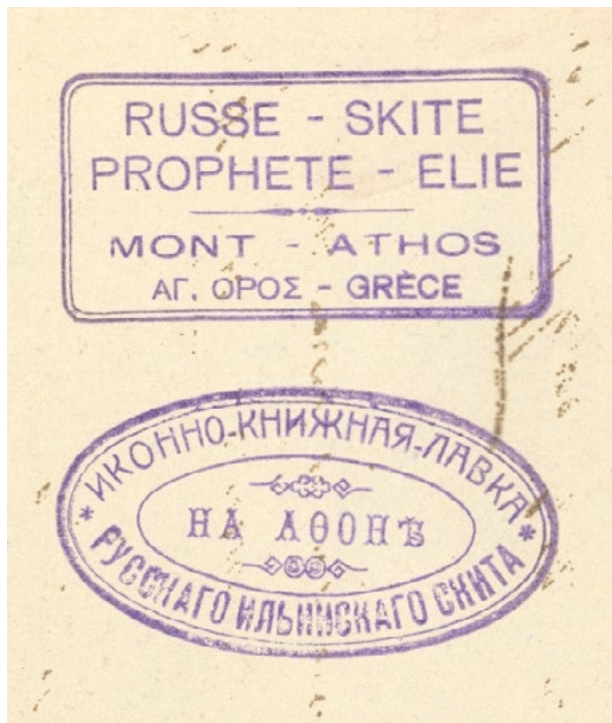
Печати иконно-книжной лавки Русскаго Ильинскаго скита на Аѳонѣ

хотя первое упоминаніе о библиотекѣ обители было въ связи съ пожаромъ только что построеннаго братскаго корпуса въ 1935 г. По свидѣтельству братіи и очевидцевъ пожара всѣ книги погибли въ огнѣ.