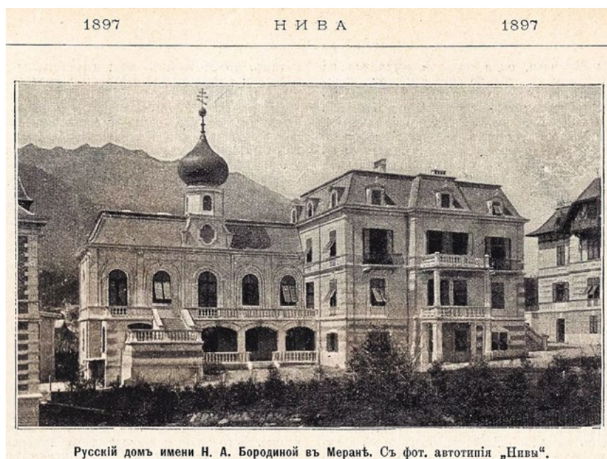
Русскій домъ имени Н. А. Бородиной въ Меранѣ. Съ фот. автотипія „Пивва“.

Въ началѣ 1948 года, «Православная Русь» напечатала обстоятельное описаніе постриженія въ мантию молодыхъ рясофорныхъ-монаховъ Флора, Лавра и Алипія, приводя выдержки изъ этого умильтельнаго и содержательнаго чина. Узнавъ изъ одного изъ послѣдующихъ номеровъ «Православной Руси», что при монастырѣ въ октябрѣ 1948 г. открывается семирания,