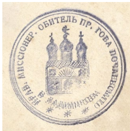
Печать Почаевской обители

Упоминанія о библиотечномъ помѣщеніи встрѣчалось при строительствѣ нижняго храма во имя преподобнаго Іова Почаевскаго. Повсейвѣроятности въ этомъ помѣщеніи въ послѣдствіи хранились только богослужбныя книги.