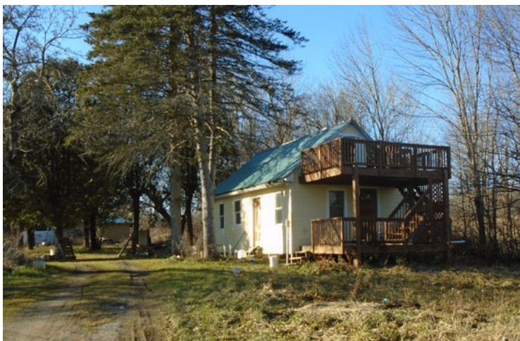
Домъ на пасѣкѣ, восстановленный стараніями о. Паисія

Отецъ Паисій полонъ строительныхъ плановъ на пасѣкѣ. Онъ сдѣлалъ форму для изготовленія каменныхъ блоковъ. Ихъ процессъ изготовленія простъ. На большой кусокъ брезента раскладывается глина въ перемѣшку съ соломой. Затѣмъ поливается водой, и растаптывается