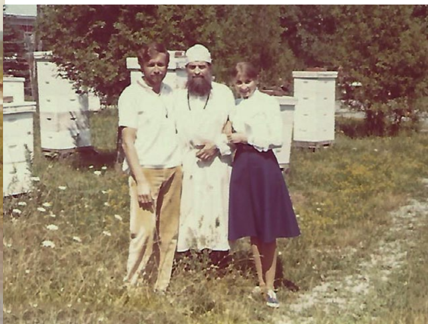
Отець Иннокентій съ дочерью и ея мужемъ на монастырской пасѣкъ.

«Яблоня». Нѣсколько лѣтъ спустя открылъ собственное дѣло. Занимался торговлей лѣсомъ и пчеловодствомъ.