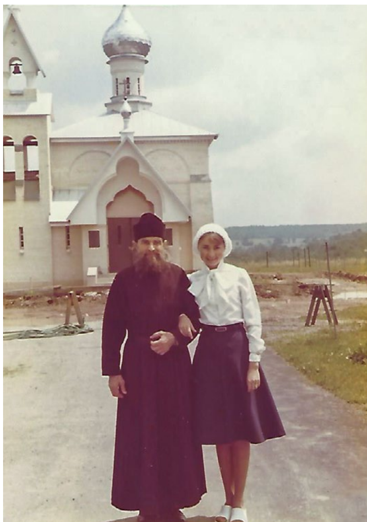
Отець Иннокентій съ дочерью на Успенскомъ кладбищѣ, июль 1975 г.

съ ихъ домомъ находились три русскихъ православныхъ храма: Иверскій, Благовѣщенскій и Софійскій. Игорь любилъ ходить на церковныя богослуженія. Послѣ окончанія школы онъ работалъ въ лѣсопромышленной компаніи «Кондо» на желѣзнодорожной станціи