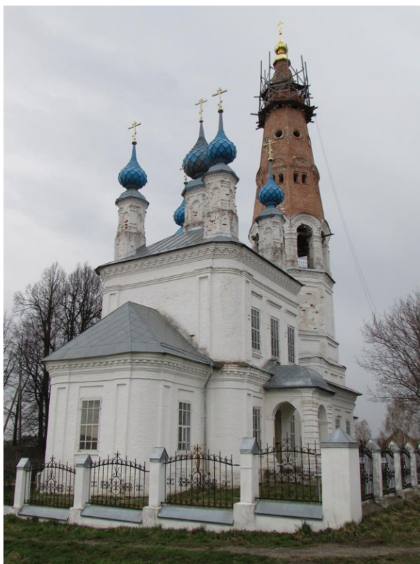
Храмъ Архангела Михаила въ селѣ Михайловское

Вернувшись въ Джорданвилль, я рассказалъ о своей