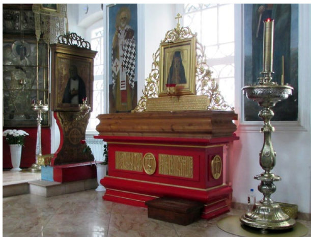
Рака съ мощами исповѣдника Леонтія

По мѣрѣ приближенія къ Михайловскому стала видна высокая колокольня сельскаго храма. Вскорѣ моему взору открылся величественный храмъ, окруженный каменной оградой, вокругъ котораго сохранилось приходское кладбище. Мы пріѣхали безъ увѣдомленія, поэтому требовалось найти священника, который бы могъ открыть храмъ. Къ намъ подошли нѣсколько мѣстныхъ