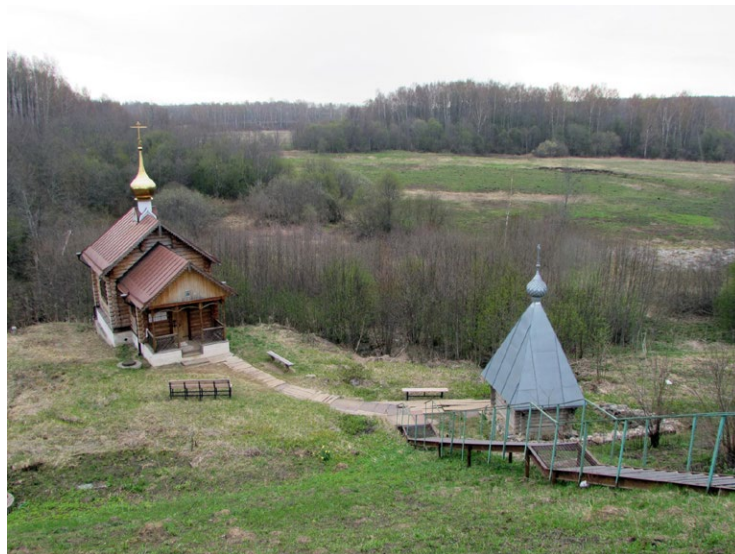
Часовня Леонтія Михайловскаго надъ святымъ источникомъ

Мы же обратимся къ доступнымъ официальнымъ свѣдѣніямъ: «Св. Архистратига Михаила и безплотныхъ Силь села Михайловскаго, каменная, съ каменною