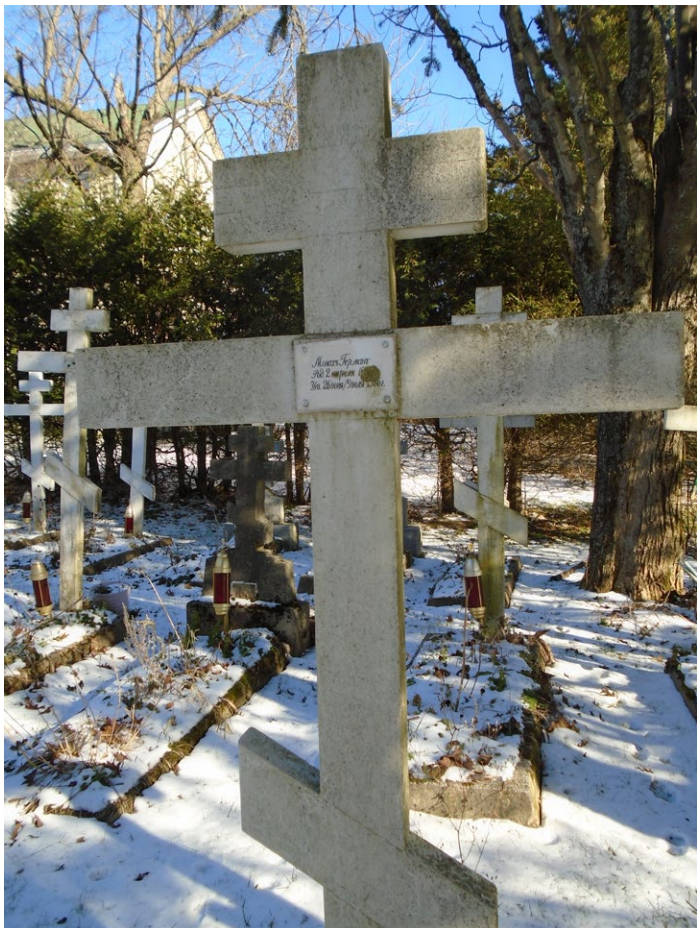
Могила Монаха Германа на братскомъ кладбищѣ Свято-Троицкаго Монастыря

былъ опредѣленъ для проживанія въ бѣженскій лагерь «Магдалина», гдѣ онъ находился до мая 1945 г. 2 іюня 1945 г. Василия Прохорова переводятъ въ ДП лагерь № 52, который тоже находился въ Лиенцѣ. Далѣе, въ маѣ 1946 г., онъ попадаетъ въ ДП лагерь Ридъ № 701 и прислуживаетъ въ лагерномъ храмѣ.