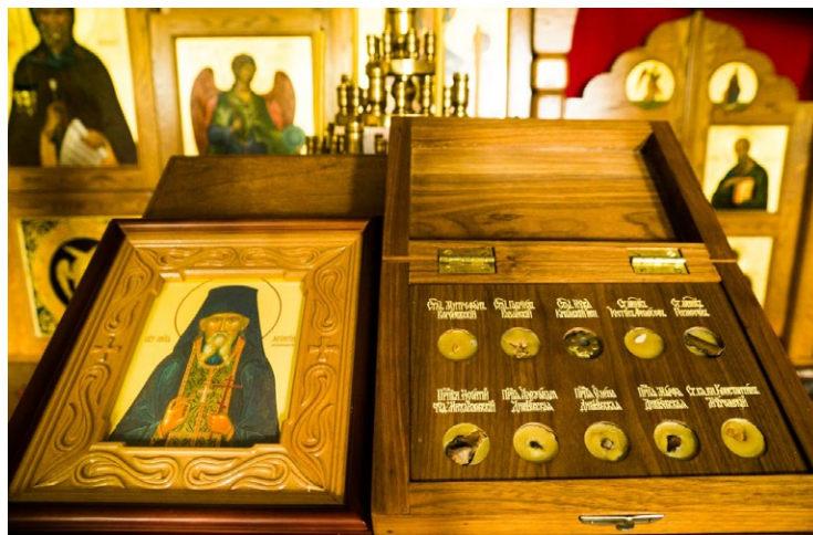
Икона и частица мощей исповѣдника Леонтія Михайловскаго въ часовнѣ Оптиныхъ старцевъ