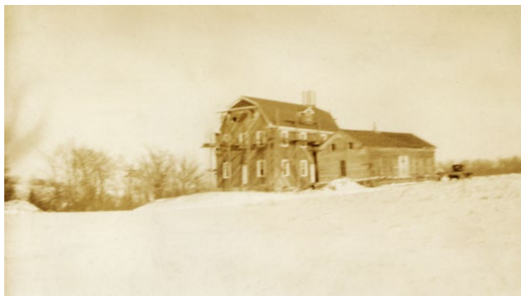
Строительство первого братскаго корпуса, зима 1934-35гг.