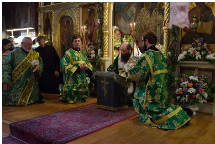
Епископъ Николай читаетъ первую колѣноприклоненную молитву

Въ канунъ празднованія Престольнаго праздника въ Свято-Троицкомъ монастырѣ, когда въ обитель пріѣзжаютъ многочисленные паломники и наполняютъ главный храмъ обители во время богослуженій, задаешься вопросомъ: какъ отмѣчался престольный праздникъ въ монастырѣ раньше, когда былъ освященъ только что построенный храмъ во имя Святой Троицы?